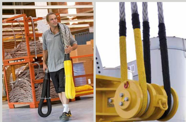
ULTRALEHKÉ TEXTILNÍ SMYČKY