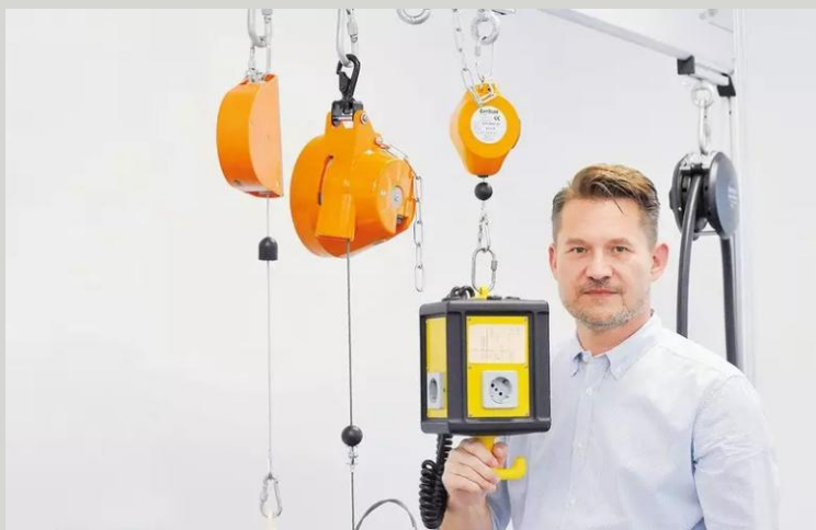
BALANCERY, RETRAKTORY A VYVAŽOVAČE