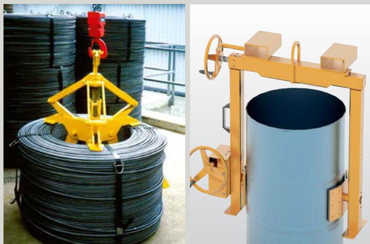
KLEŠTĚ A UCHOPOVADLA