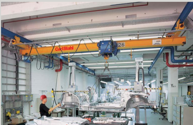
MOSTOVÉ PODVĚSNÉ JEŘÁBY