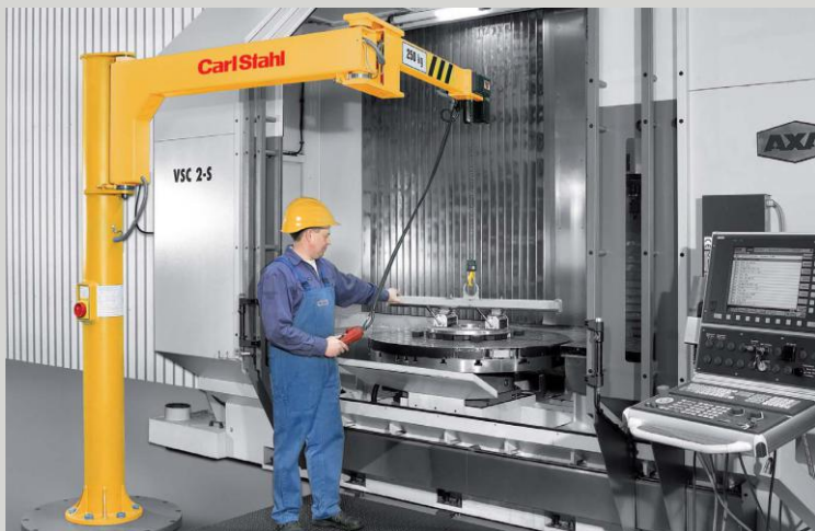
SLOUPOVÉ JEŘÁBY S KLOBOVÝM ÚLOŽNÍKEM