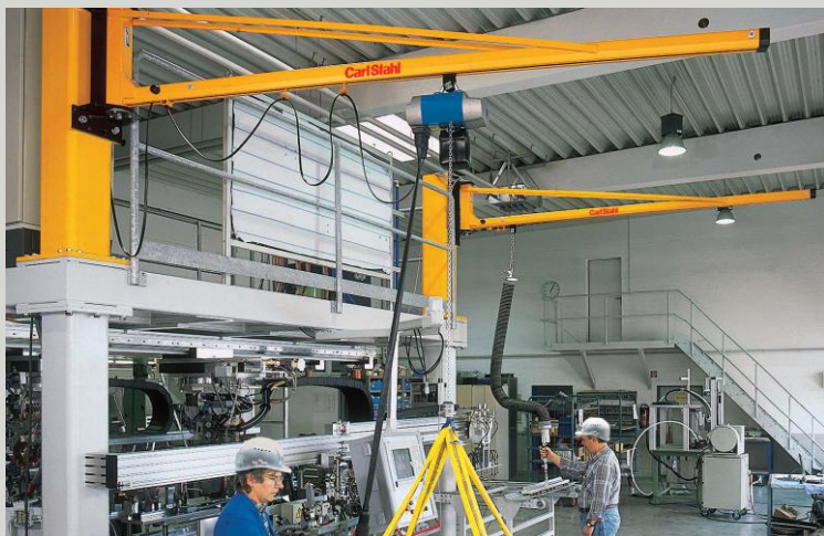
SPECIÁLNÍ SLOUPOVÉ JEŘÁBY