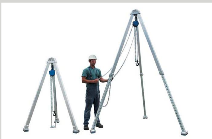
TROJNOŽKY S KLADKOSTROJEM