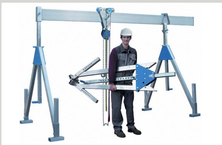
ALU MOBILNÍ PORTÁLOVÉ JEŘÁBY