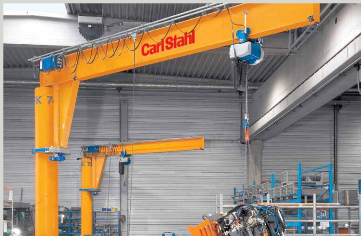
STANDARDNÍ SLOUPOVÉ JEŘÁBY