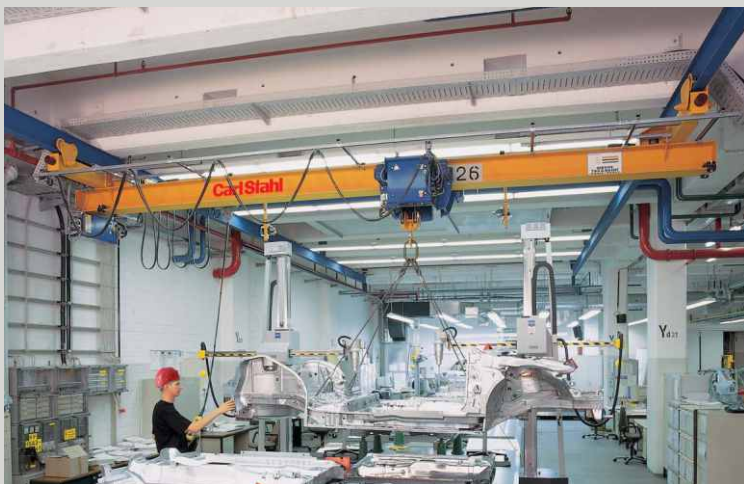
MOSTOVÉ PODVĚSNÉ JEŘÁBY