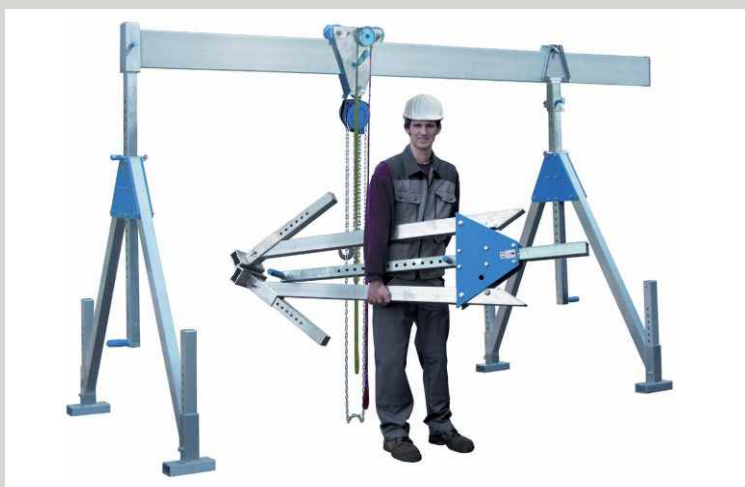
ALU MOBILNÍ PORTÁLOVÉ JEŘÁBY