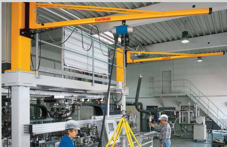
SPECIÁLNÍ SLOUPOVÉ JEŘÁBY