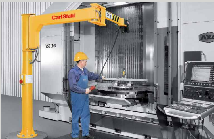
SLOUPOVÉ JEŘÁBY S KLOUBOVÝM ÚLOŽNÍKEM