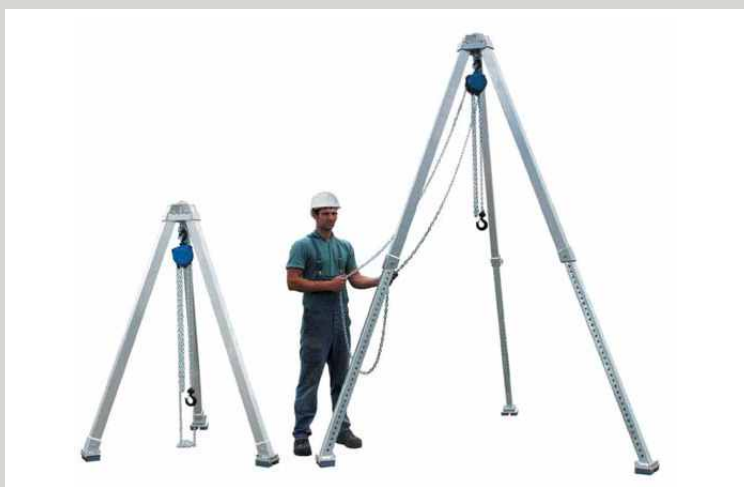
TROJNOŽKY S KLADKOSTROJEM