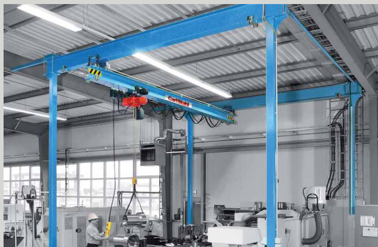
JEŘÁBOVÉ PORTÁLOVÉ SYSTÉMY