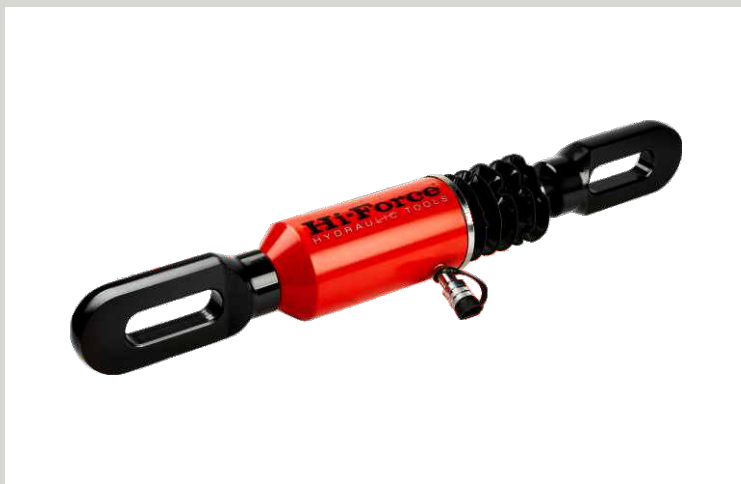
HYDRAULICKÉ VÁLCE TAŽNÉ