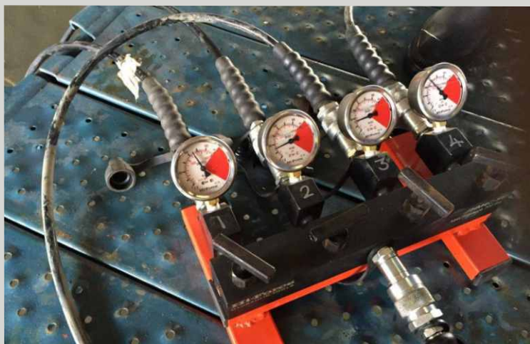
MANOMETRY S ROZDĚLOVAČEM