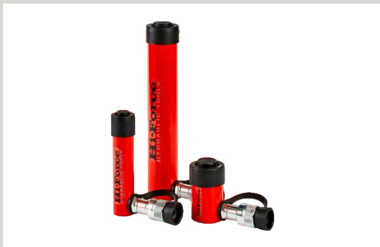
HYDRAULICKÉ VÁLCE JEDNOČINNÉ