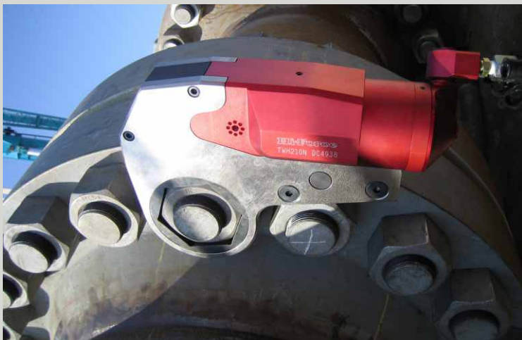
MOMENTOVÉ KLÍČE NÁSTRČNÉ