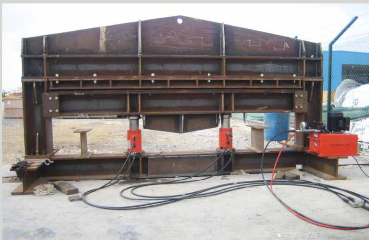
MANUÁLNÍ A ELEKTRICKÁ ČERPADLA