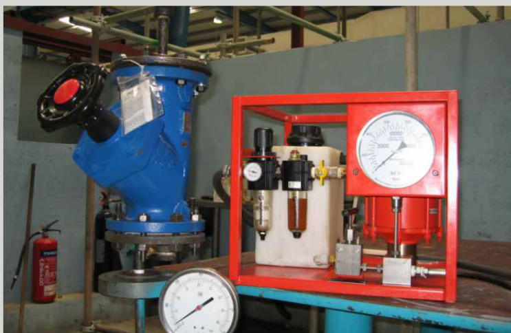
ČERPADLA NA HYDROTESTY