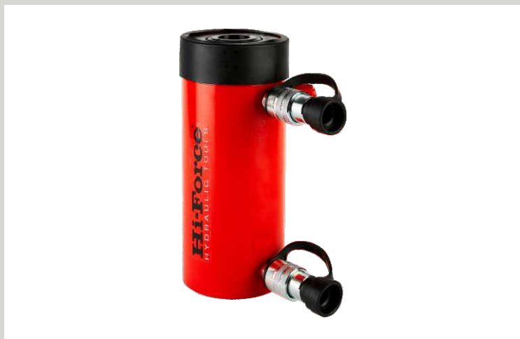
HYDRAULICKÉ VÁLCE DVOUČINNÉ