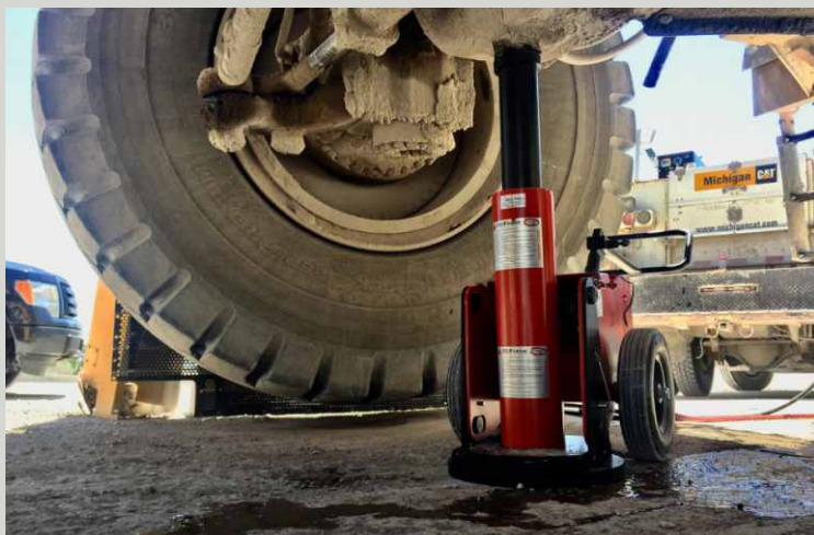
ZDVIHACÍ SYSTÉM TOUGHTLIFT