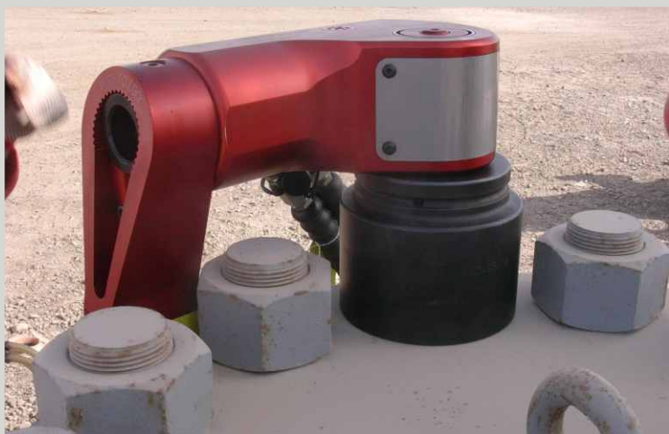
MOMENTOVÉ KLÍČE NA OŘECHY